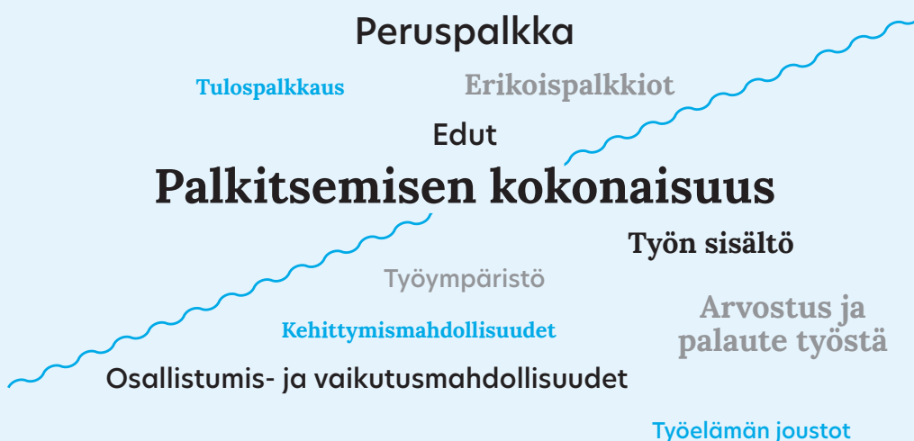
Kuva 1: Palkittamisen kokonaisuus

Aineettoman palkittamisen merkitys on viime vuosina kasvanut. Erityisesti työelämän joustoihin liittyviin palkittamistapoihin kiinnitetään enemmän huomiota ja monet palkansaaajat arvostavat toimintamalleja, joilla parannetaan kokonaisvaltaista elämänhallinnan tunnetta.